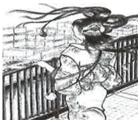
②④ 二口女 弘果周辺