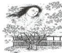
②古木の精 弘前公園