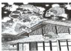
⑬ 藻の花の幽 霊 津軽藩ねぶた 村