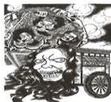
⑱ 臙車 土手町