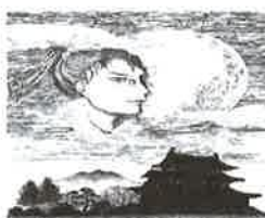
②③ 桂男 弘前公園 本丸