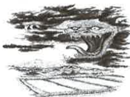
⑰ 赤舌 津軽地方の田