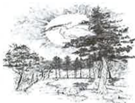
⑲ 青鷺火 弘前公園 三の丸