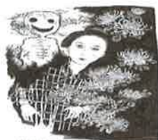
⑪ 菊人形 菊と紅葉祭