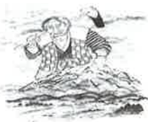
⑤鬼沢の大人 弘前市鬼沢