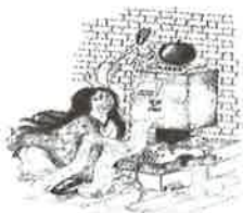
③文庫妖妃 弘前駅 林檎ポスト