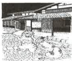
⑮ 猫また 亀甲町広場