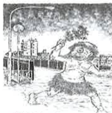
②⑦ 山わら 駒越周辺