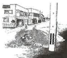
⑯ 髪鬼 北横町