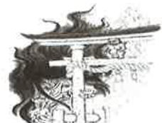
⑥おとろし 撫牛子八幡宮