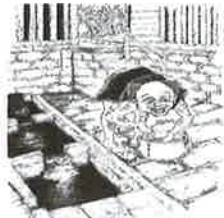
⑦小豆洗い 富田の清水