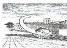
⑫ ろくろ首 下白銀町 裁判所