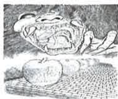
②① 鬼一口 えきどて プロムナード