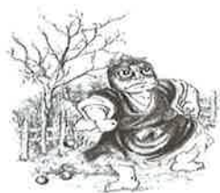
⑨たんころりん 撫牛子近辺