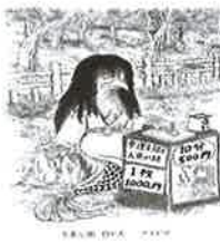
③⑩ アマピエ 弘前公園

(株)つがるねっと 就労継続支援B型 バナナの樹 Tunagari Art House Banana