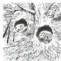
②⑥ つるべ落とし 弘前公園大銀 杏