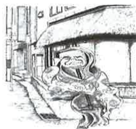
②② 三味長老 親方町