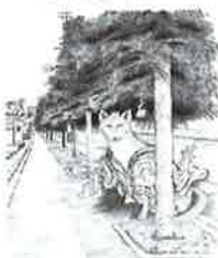
②⑧ キツネ 野田北大通り