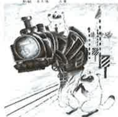
②⑨ たぬき 城北公園交通 広場