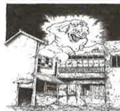
⑧うわん 山道町の廃屋